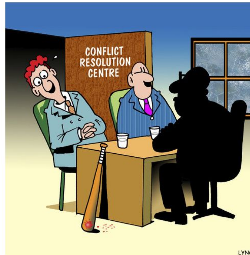
Mark Lynch, October 8, 2019, in https://donmcminn.com/2019/10/a-good-technique-for-resolving-conflict-and-misunderstandings/#